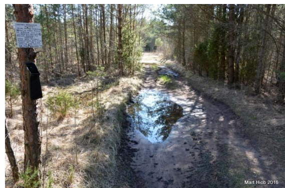
Foto 99. Tee Neeme külas Urva talu läheduses.

Tänapäeval on rahvusparki jäävad teed pinnasteed.