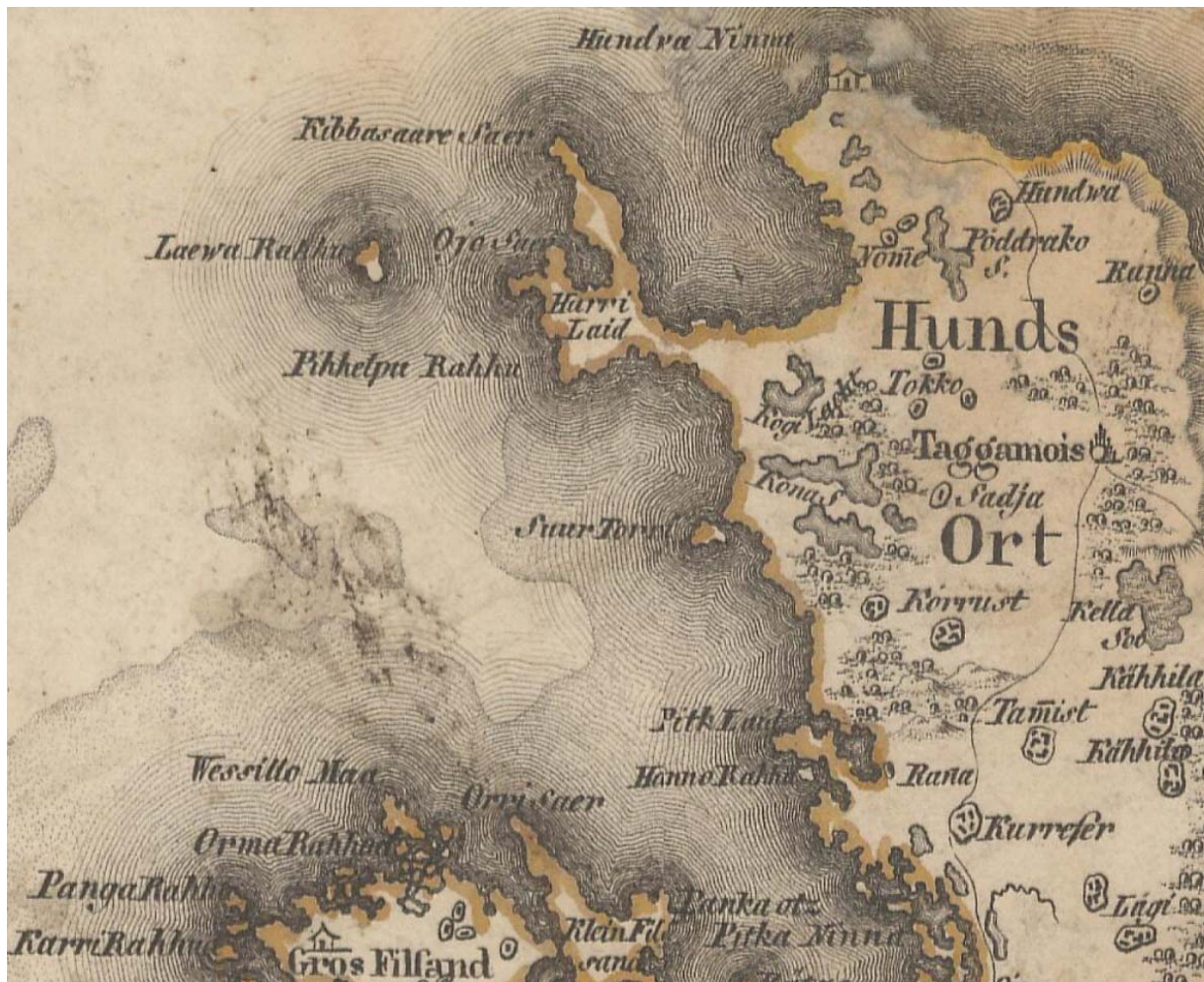
Joonis 52. Väljavõte 1793. a Mellini kaardist, kus on näidatud Neeme küla kujul Nome . EAA, f 854, n 4, s 470, l 8k.

Rahvusparki jääb asustusest vaid Urva nimeline pärast iseseisvuse taastamist ehitatud hooajaline elamu küla ajaloolisest asustusest edelas. Nimi Urva on aga samas piirkonnas ära toodud juba eelpoolnimetatud 1796. a kaartidel – Urwa Welli , Urwa Peld ja Urwa Allik .