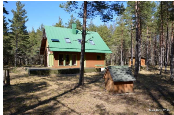
Foto 98. Uushooned Neeme külas Urva maaüksusel. Foto Mart Hiob 2015.

toodud ka väiksemad külad 96 . Seejuures ulatub Neeme küla ka Harilaiu poolsaarele, mis tänapäeval kuulub Metsaküla koosseisu.