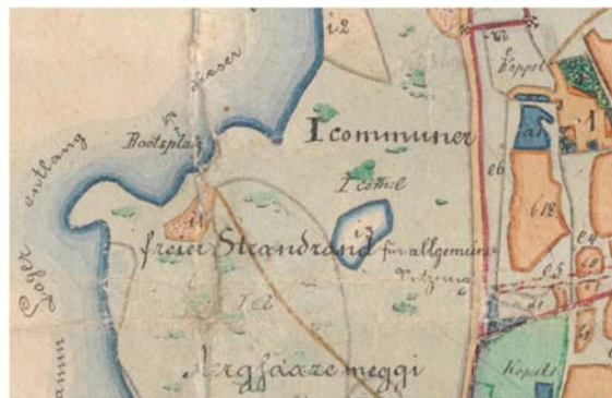
Joonis 82. Väljavõte 1883.-86. a Rootsiküla kaardist, millel on näidatud paadikoht ja avalikus kasutuses olev rand tänasel Ujumiskoha maaüksusel.

Abaja küla rannas tänasel Ujumiskoha maaüksusel (30101:003:0496) on 1883.-86. a kaardil 174 näidatud meres paadikoht ( Bootsplatz ) ja selle kõrval avalikus kasutuses olev rand ( freier Strandrand für allgemeine Benutzung ). Selle koha võiks võtta kasutusele ka tänapäeval, sest autoga sõidetav pinnasteed, mis ei läbi taluõuesid, on juurdepääsuks säilinud (ühiskondlik ala nr 22, vt Joonis 81). Koht võiks teenindada nii Abaja küla kui ka Kihelkonna aleviku elanikke ja külastajaid, kel on soov pääseda mere äärde.