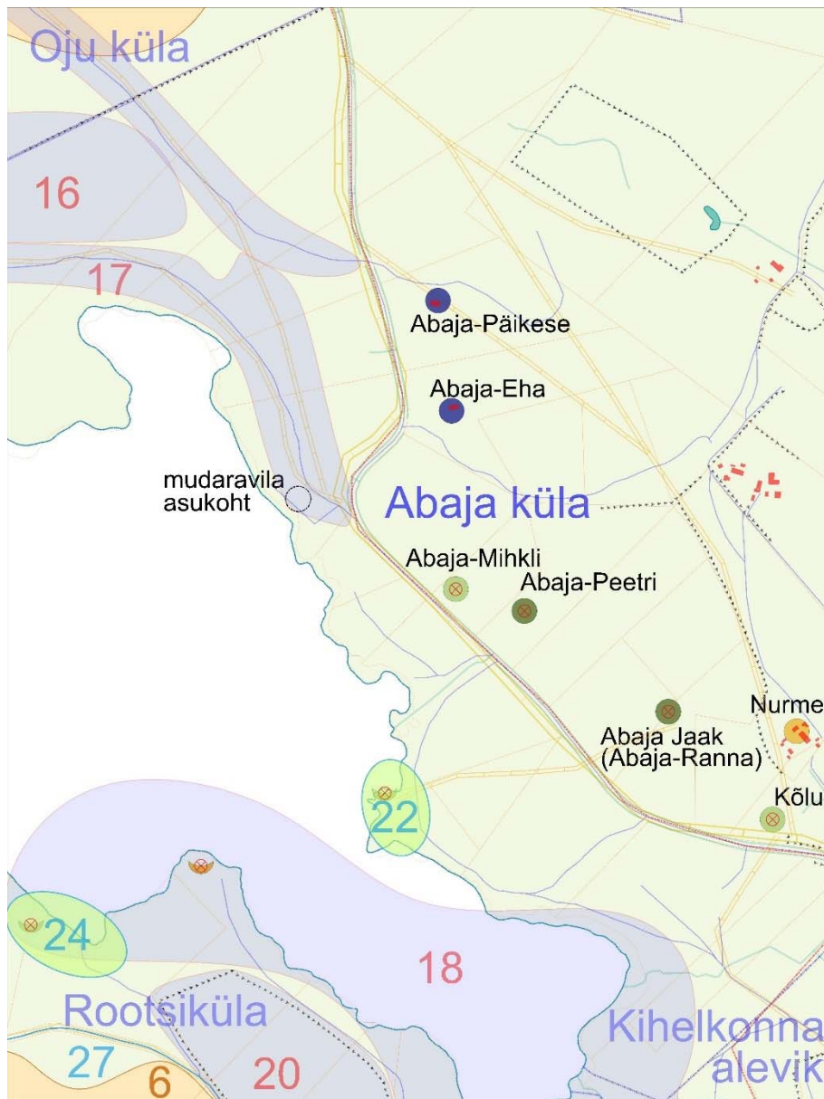
Joonis 81. Abaja küla rahvusparki jääva osa talukohtade vanuseline areng ja paiknemine, samuti küla ilmekad pärandkooslused (lilla ala) ja ühiskondlikud alad (rohelised). Joonisel on ajaloolised talukohad (värvilised sõõrid, punase ristiga hävinud kohad), ajaloolised teed (kollane), tänapäevased teed (tumesinine), tänapäevased katastripiirid (ruuge), külapiiir (sinine katkendjoon), rahvusparki piir (punane katkendjoon), tänapäevane hoonestus (punane) ja kiviaiad (must täpijoon). Tingmärkide seletust vt Joonis 9, lk 40.