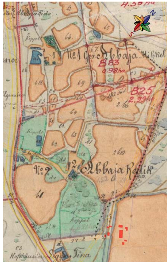
Joonis 80. Väljavõte 1883.-86. a Rootsiküla kaardist, millel on näidatud Abaja Mihkli ja Abaja Reediku talu. Lisaks on kaks moonaka kohta – Abaja Rido ja Sige Tiina. Punasega on näidatud tänane hoonestus Nurme maaüksusel. Antud kohad jäävad kõik rahvuspargist välja, sest rahvusparki piir jääb kaardi vasakus servas näidatud teest läänepoolse. EAA, f 3724, n 5, s 2935, l 1k.

Kihelkonna alevik administratiivselt ka Abaja küla.