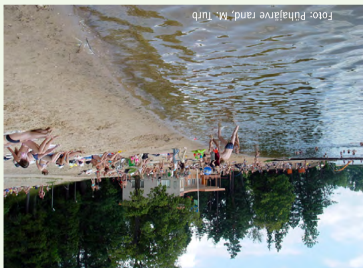
Foto: Pühajärve rand

kuuklikke maastike hoidmiseks ja tutvustamiseks. Kõrgustikust ning on loodud Otepää kõrgustikule iseloomulike suuna. Otepää looduspark (224 km²) hõlmab ca 1/5 Otepää hoiu kaitse alla, et keelata nende muutmise ulatusse sobimatust ümbrusest. 1929. a. võeti Pühajärve ühes pargi ja saartega tervis-Otepää piirkonna maastike kaitse on saanud alguse Pühajärve OTEPÄA LOODUSPARK