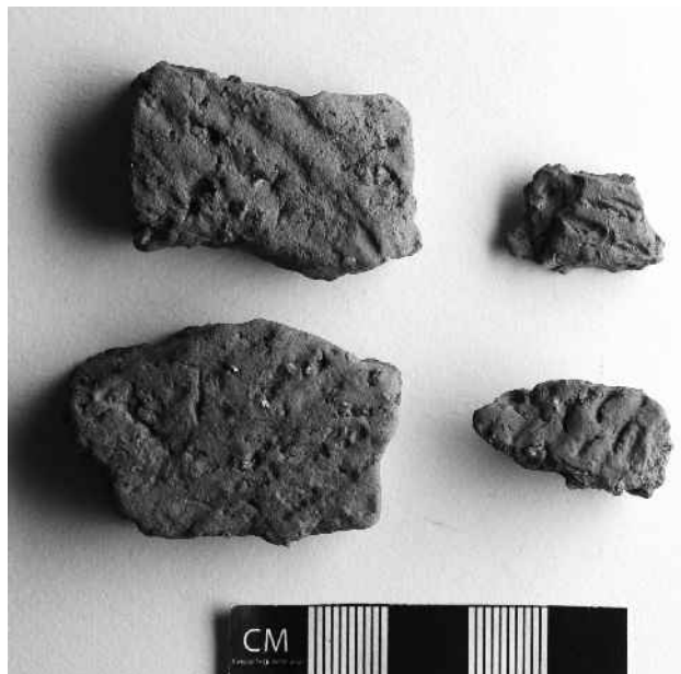
Mikila ja Ähijärve lähistelt leiti riidejäljendiga ja küüntejälgedega kaunistatud keraamikat, mis pärineb roomarauaajast.

Kevadel otsiti uusi asulakohti. Selleks kasutati ajaloolisi kaarte ja nende järgi uuriti rootsiaegsete talukohtade ümbrust. Kõige paremini sobivad niisuguseks uuringuks küntud põllud. Karulas tulid appi ka mutid ja metssead, kes olid pinnast avanud. Lahtises mullas viitavad asulakohale tume muld ja mullas leiduvad potikillud. Potikildude abil õnnestub arheoloogidel ka ligikaudselt määrata asulakohtade vanus. Kõige vanem asustusjalg leiti Karulas sel aastal Patuperäst, kus mutimullahunnikus leidis üks kiviajast pärinev tulekivi kild. Vanimat keraamikat leiti Mikila järve kaldalt ja Ähijärve lähedalt, sealsetel savinõukildudel olid näha sõmeküünte vajutustega ja tekstiilijäljendiga tehtud kaunistused. Niisugune keraamika pärineb arvatavasti roomarauaajast (50–450 p.m.a). Mikila