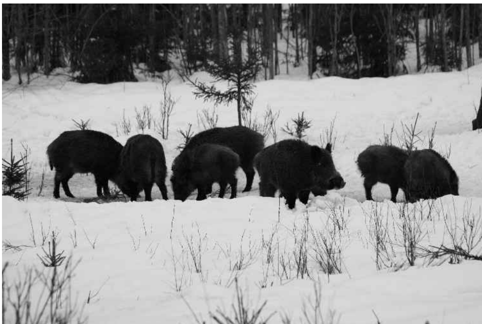
Metssead talvistest toimingutes.

Üks sigade massilise rände põhjus on kahtlemata suvised viljapõllud. Viljapõldude kaitse ja kahjustuste kontrolli all hoidmine on jahimeeste ülesanne koostöös maaomanikega. Parimal moel näeb koostöö välja selline, et maaomanik jagab juba kevadel põldu külvates infot külvatavate kultuuride kohta jahimeestega ning jahimehed püüavad tagada põldude kaitse. Seega kutsume üles maaomanikke andma jahimeestele infot oma põllu- ja metsakultuuridest, et neil oleks võimalik silma peal hoida.