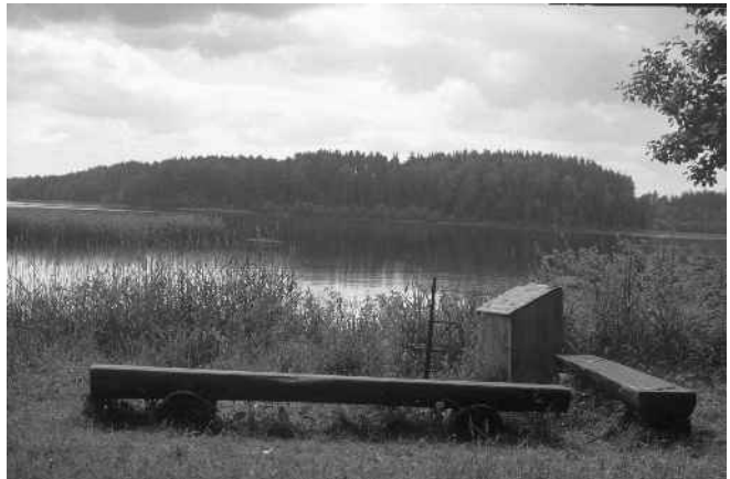
Käesoleval aastal on lõkkeplatsid loodusvahil hooldada.