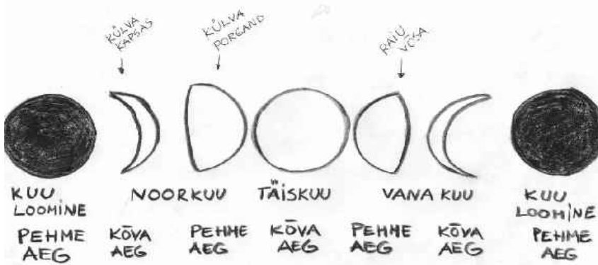
Puust ja punaseks - kuu ajad.