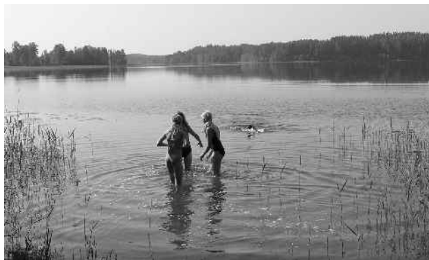
Ähijärves võivad kõik ujuda, kuid erajärves on suplus omaniku loata keelatud.

Teadmiseks olgu öeldud, et veekogu kasutamine on veevõtt, suplemine, veesport, veel ja jääl liikumine ning kalapüük – seega veekogu avalik kasutamine on veekogu kasutamine igapäev poolt eeltoodud viisidel. Tihti on probleemiks just nende veekogude ääres liikumine, mis ei ole avalikult kasutatavad. Seal liiklemiseks ning kalastamiseks on vajalik saada maaomaniku nõusolek. Vastasel juhul võibki juhtuda, et tekib konflikt maaomaniku ja loodusenaütija vahel. Näiteks on taoline oht olemas Karula rahvusparkis asuvate Suur Saarjärve (VEE2134500)* ja Väike Saarjärve (VEE2134600) ääres liikudes. Mõlemad järved on eraomandis ega ole avalikult kasutatavad. Seega kui neil järvedel soovitakse tegeleda eeltoodud veekogu avaliku kasutamise mõiste alla arvatud tegevustega, on selleks vajalik saada maaomaniku luba.