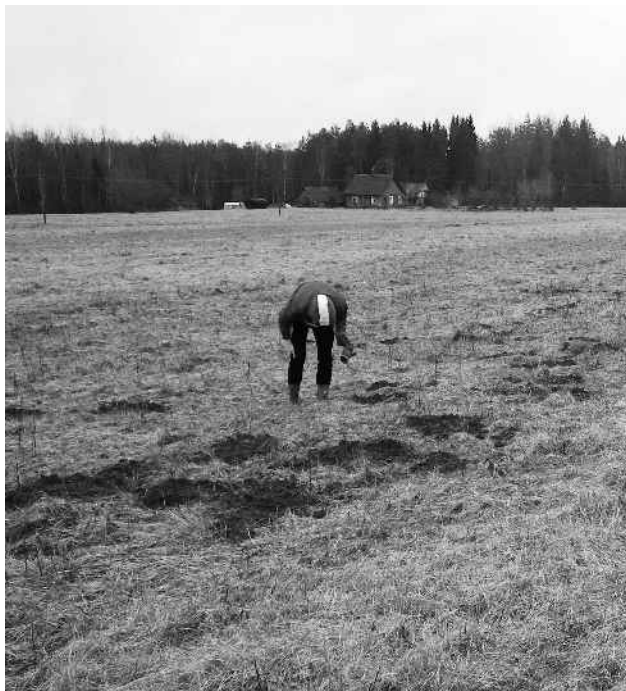
Apja küla mullamutid olid abivalmilt potikilde maapinnale kandnud

Eelmisel aastal otsiti Karulas seni leidmata muistiseid ehk toimus arheoloogiline luure. Selle käigus sai Karula kaugem minevik olulist täiendust. Eesti-Läti-Venemaa piiralade rahvusvahelise koostööprojekti "Archaeology, Authority and Community (AAC) raames toimub arheoloogiline luure ehk inspeksioon viieteistkümnnes kihelkonnas, nende seas ka Karulas.