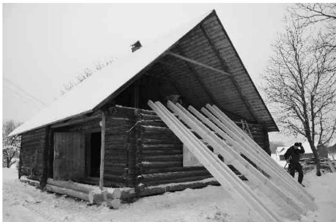
Ait Karula rahvuspargi keskuses sai uue näo.

Suuremad teemad, millega Keskkonnaamet 2012. a Karula rahvuspargis tegeles, olid osalemine Meie Karula projektis ja koostöökogu moodustamine; Karula kaitsekorralduskava vaahindamine; rahvuspargi keskuses asuvasse aita ekspositsiooni kavandamine ja tellimine; maastike ja poollooduslike alade hooldamine ning kaitsealuste liikide ja koosluste inventuurid.