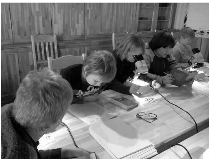
Lapsed Karula rahvuspargi loodusõppeklassis teadmisi omandamas.

Viie aasta jooksul on läbi viidud 105 õppeprogrammi milles osales 2223 last. Samuti on korraldatud matka- ja loodushariduspäevi, looduslaagreid ning läbi viidud looduskaitsekuu raames maastikumäng. 2013. aasta kevadeks valmib etnograafiline ekspositsioon rahvuspargi keskuse aidas. Välja on antud rahvuspargi infolehte „Tarupettai“. Jätkuvalt on toimunud traditsiooniline käsitööpäev-simman. Maaomanikele on korraldatud nõupäevi, jahimeestele infopäevi. Loodud on Karula rahvuspargi koostöökogu, et tagada info kättesaadavus ning kaitsta kõigi asjasse puutuvate huvigruppide huve.