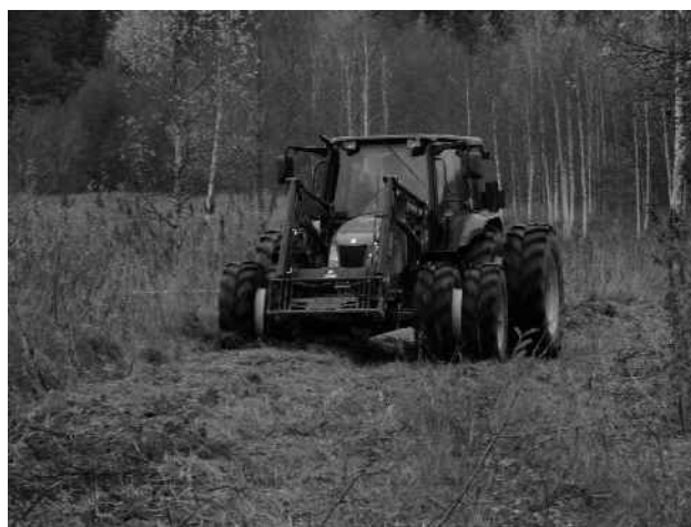
Poolloodusliku koosluse hooldamine Ähijärvel.

Eesti Ornitoloogiaühingu poolt viidi läbi Karula Natura linnuala eesmärkideks olevate liikide inventuur. Uued arvukushinnangud said haudelinnustiku kaitsekorralduslikult olulisemad liigid. Varasemate arvukushinnangutega võrreldes (Leibak, E., 2000, Evestus, T., 2004) on oluliselt muutunud näiteks laanepüü arvukus. Kui varem arvati neid olevat Karulas 50-150 paari, siis nüüd arvestatakse 30 – 40 paariga. Laanepüü on ka ainus liik, kelle puhul on arvukus tehtud inventuuri tulemuste kohaselt väga oluliselt kukkunud. Öösorri uus arvukushinnang 30-40 paari näitab aga võrreldes 2000. aastaga kahekordset kasvu. Mõõduka kasvava trendiga on ka enamuse