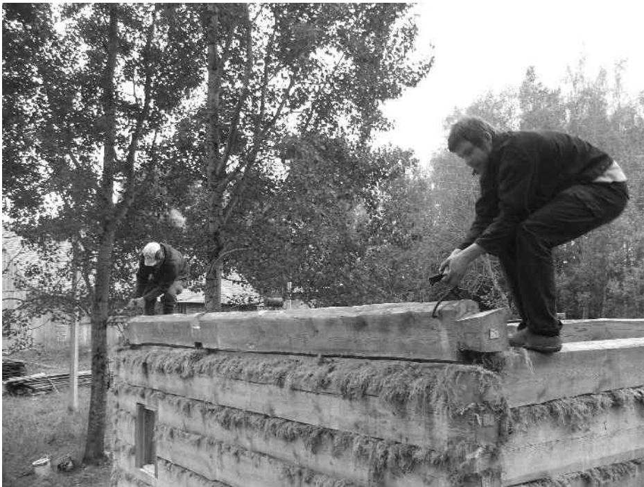
Suitsusauna ehitamine Rebasemõisa külas.

Lisaks kõnealustele hoonetele on rahvuspargis planeerimise etapis lauda ehitamine Hallimäe maaüksusel Rebasemõisa külas ja elumajade ehitamine Alakonnu maaüksusel Mähkli külas ning Tätta maaüksusel Rebasemõisa külas.