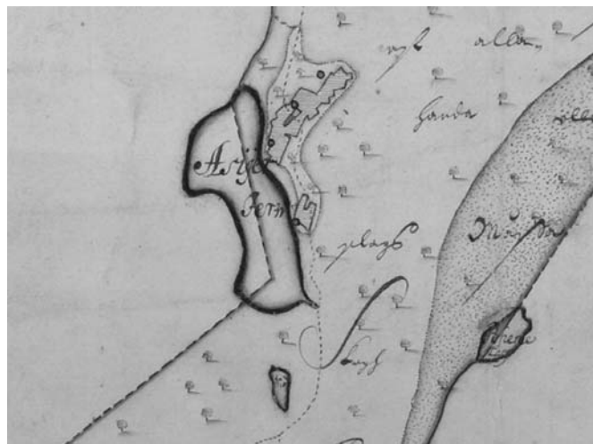
Rootsiaegne Antsla piirkonna kaart.

Piirid määrati alguses kirjelduste abil. Esimesed maaval-