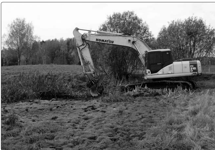
Sellist pilti võib ka järgnevatel aastatel Karulas näha.

Mudakonn on ainus Eestis leiduv konnaliik, kelle isasloomad häälitsevad sigimisajal vee all, lombi põhjas olles. Seepärast pole mudakonna vaikset, koputusele sarnanevat kutsehüüdu just väga kerge palja kõrvaga kuulda ning appi tuleb võtta erilise riistapuu – hüdrofon. Hüdrofon püüab kinni kõik veealused helid ja teeb need kõrvale kergesti kuuldavaks. Just seda aparati kasutades kontrollisime maikuu mitmeid Karula veekogusid, et teada saada millistes neist mudakonnad „laulavad“ ja millistes mitte. Nii avastasime ka kolm uut, seniteadmata mudakonna sigimispaika – üks Rebasemõisa ja Kolski vahelises kopratiigis, teine Koobas-