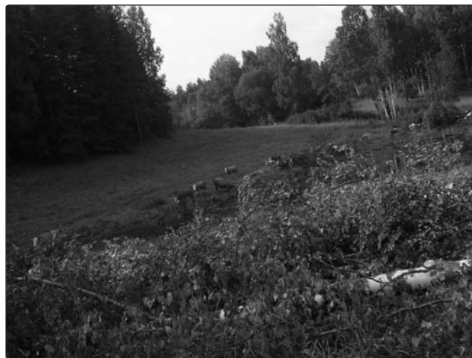
Vana talukoha taastamine.

Elektriliini rekonstrueerimiseks anti üks kooskõlastus – Mäekonnu-Värtemäe liini rekonstrueerimine. Elektriliinide