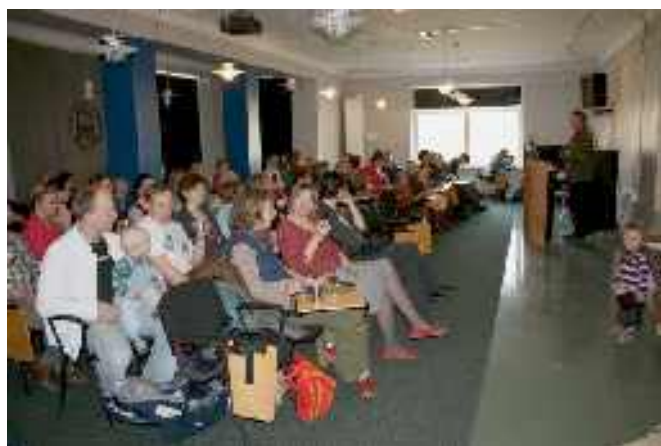
Raamatu esitus Eesti Rahva Muuseumi näitusemajas

Raamatu andis välja MTÜ Karula Hoiu Ühing. Projekti rahastas SA Kodanikuühiskonna Sihtkapital.