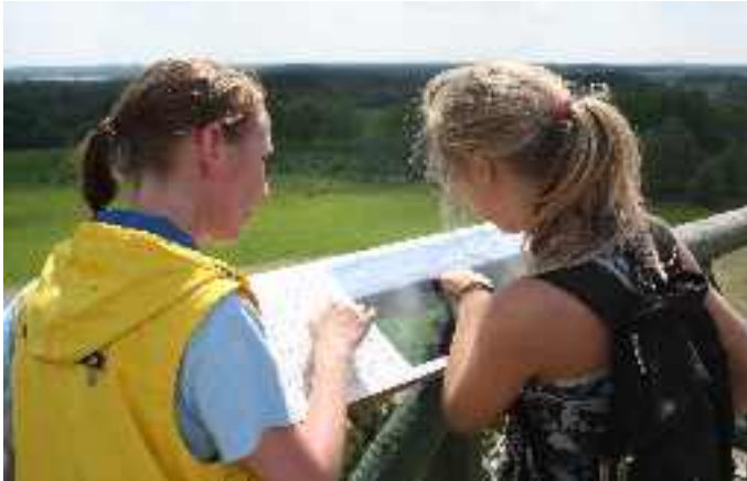
Mäekonna tornis.

Emajõe linnaku äärealadelt pärit tüdrukuna näen siin palju silmale harjumatu. Ja neile, kes Norra minna plaanivad, soovitan kindlasti esmalt oma maa küngastest alustada. Iseseisvalt kaardi järgi siia sõites panin kokku 58 kilomeetrit võssa. Siin kehtib kindlasti mõte, et Karulasse ei satuta, Karulasse tullakse plaanitult.