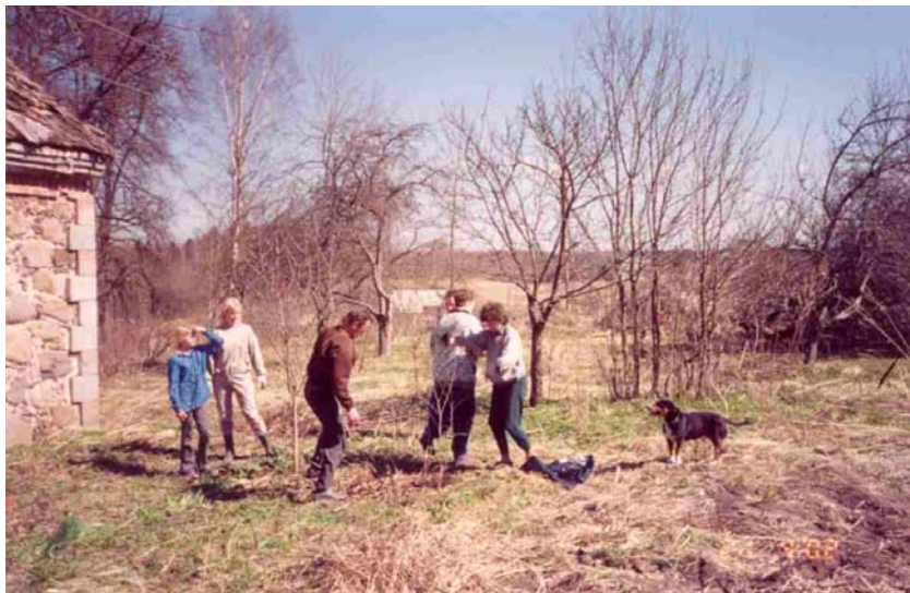
Talgud Rebasemõisa külas

Kuid plaane on veel ja veel ning aastate jooksul püüame ühiselt enamuse neist ka täide viia. Kuidas see meil õnnestub, seda saame juba kõik jälgida.