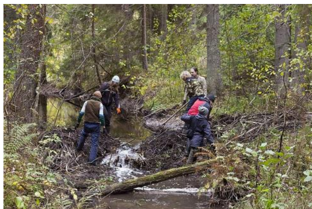
Kopratammid takistavad ojas kalade liikumist ja tuli seepärast eemaldada.

Laupäeva õhtul peale tööd said kõik talgulised sauna, sest mis on talgud ilma saunata – nagu