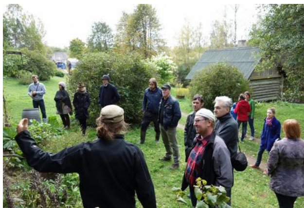
Ansi-Mähkli aidaga tutvumas.

arvestades oma vana maja taastamist planeerida, milline on tööde järgnevus palgivahtetisel ning kuidas erinevaid puidukahjustusi hinnata. Karula arhitektuurireis kulges marsruudil Ähijärve – Sibula talu rehielamu – Ansi-Mähkli talu – Lajassaare – Karkküla rehi – Hallimäe talu – Ähijärve.