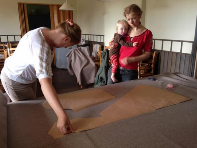
Lõike seadmine kangale.

Kuigi olen üle kümne aasta Vana-Võromaal elanud, on juured siiski Põhja-Eestis ja seetõttu tekkis kuuldes sõna "suursärk" tunne, et tegemist on esemega, mida on lihtne õmmelda. Kui