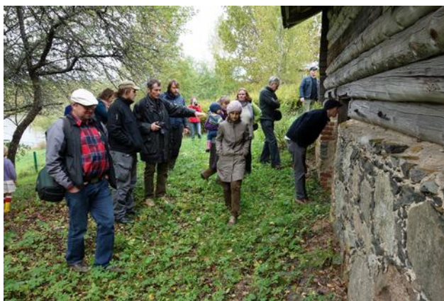
Sibula kuivatit lähemalt vaatamas.

Karula rahvuspark lummas kõiki reisile kogunenuid oma voogava maastikuga, kuid lisaks sügise looduse nautimisele saime kuulda Karula asustuse kujunemisest ning sellest, kuidas rahvusparkis jõuti rahvusparki tollase administratsiooni ning kohaliku kogukonna koostöös ehituslike erinõueteni. Karulas on kokkuleppeliselt väärtuslikuks loetud kogu nõukogude-eelne arhitektuur ning ehitatavad hooned peavad järgima ümbritsevate hoonetega sarnast stiili. Selleks, et miljööväärtusi hoida ning sarnaste arhitektuursete lahendustega külamaastikke ühtsetena hoida, peavad majaomanikud oma hoonete taastamise üsna põhjalikult läbi mõtlema, ent tulemuseks on ilusad arhitektuuriliselt terviklikud külad. Karula kogemused on heaks eeskujuks teistele miljööväärtusi säilitada soovivatele kogukondadele. Ehkki võib tunduda, et ehituslikud erinõuded on omanikule piiravad, on need tegelikult enamasti seotud renoveerimise hea tava rakendamisega, mida on läbi aastate propageerinud ka Vanaajamaja. Karulas jagaski Vanaajamaja meister erinevate hoonete juures ka konkreetseid nõuandeid. Arutleti, kuidas rahvusparki nõudeid