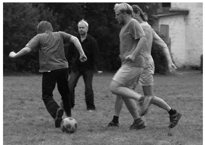
Jalgpall Vanan-Koiolan 2004.