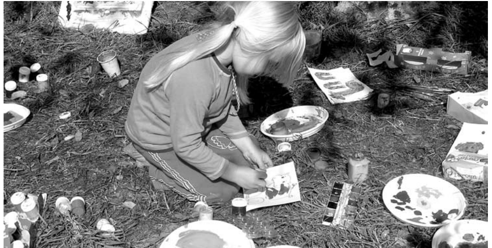
Laagrist saavaq ossa võttaq nii latsõq ku täüskasunuq.