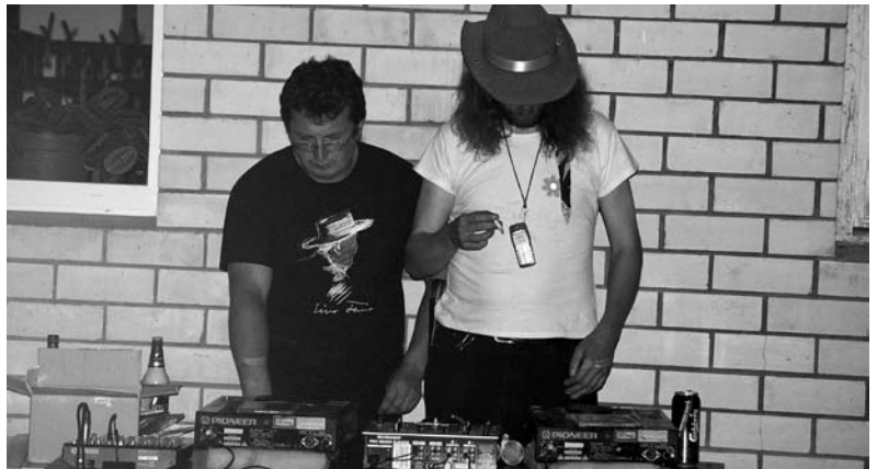
Rahmani ja Ilvese võrokeeline disko Ruusal 2007.