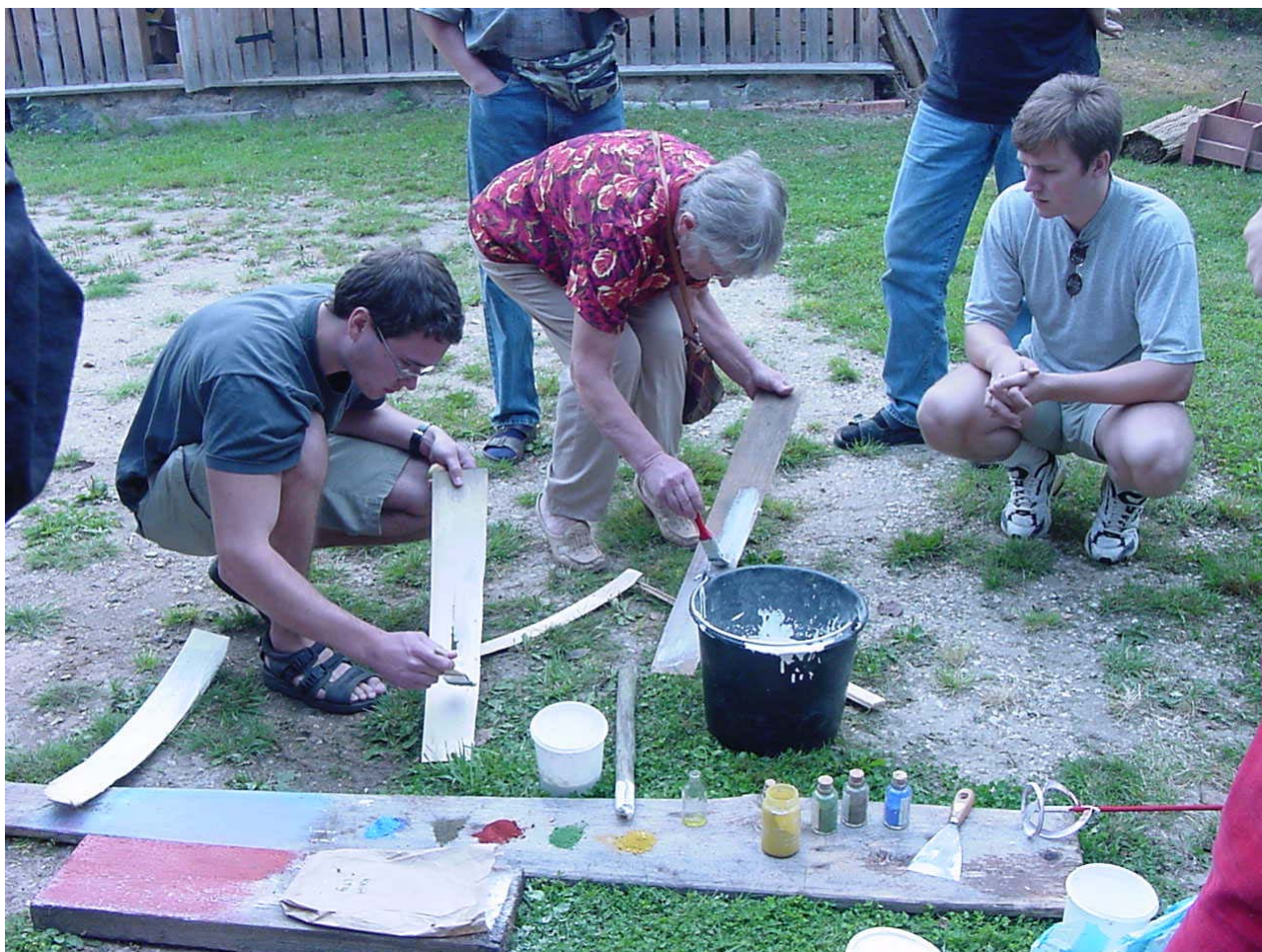
Ehituskoolitusel osalejad ökoloogilisi värve katsetamas