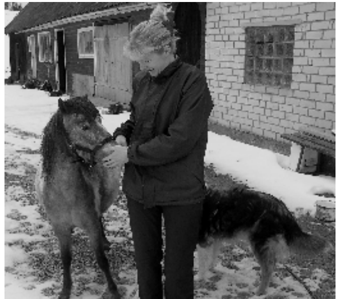
Evi koos minihobusega.

E.K: „Meister ja Margarita“ meeldis. Kivirähu „Rehepapp“ on ka väga hea raamat.