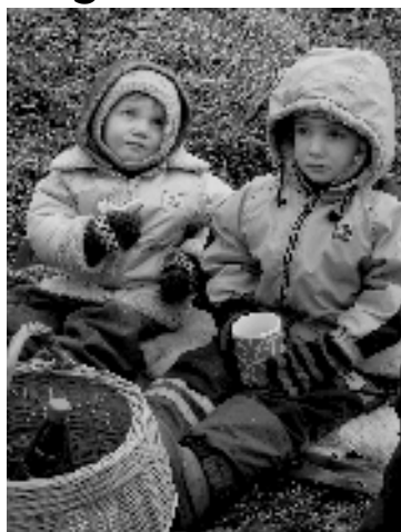
Talgutele tuli lapsed...

Inimesi tuli nii Karula kihelkonna lõuna- kui idapiirilt. Toekamaid töökäsi oli üle kahekümne paari ja lapsepudinaid pealekauba. Selle rahvahulgaga sai veevõtukoha plats kähku puhtaks ning mindi veel ka Haabsaare külje alla Ränna oja pervele, kust samuti veidi võsa koristamist ootas. Talgupäev lõppes supisõõmise ja saunaga Ränna talus.