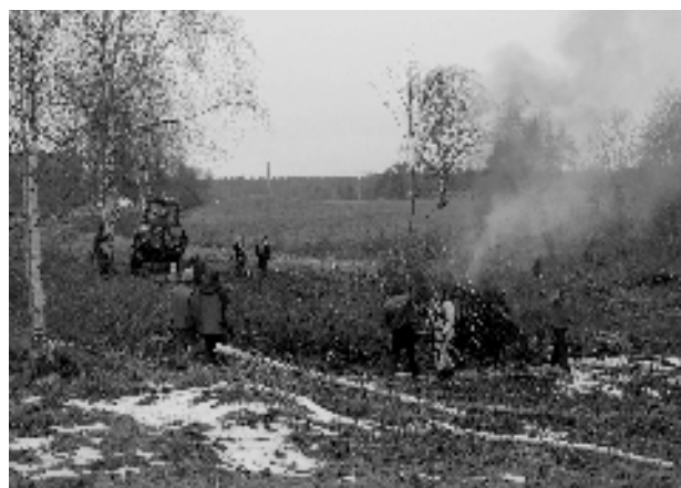
...ja nende vanemaid.