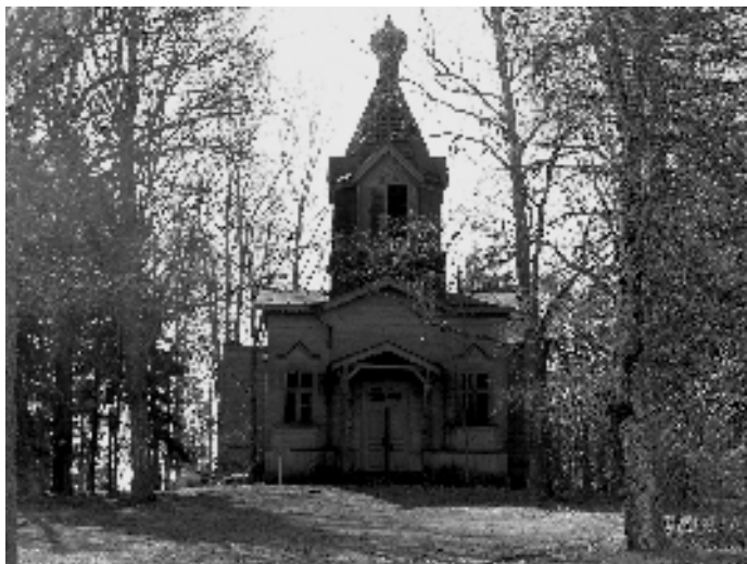
Suvel selgub ehk Kaika kiriku edasine saatus.

Tänavu on plaanis ümber koolimaja rajada korralik haljastus. Samuti esitasime PRIA-le taotluse koolimaja II etapi renoveerimise rahastamiseks. Hoiame põialt, et vastus tuleks positiivne. Suvega peaks saama ka selgeks, mis saab lagunevast kirikust, kas see lammutatakse või taastatakse osaliselt. Nii on vähemalt kirikuisade plaanid.