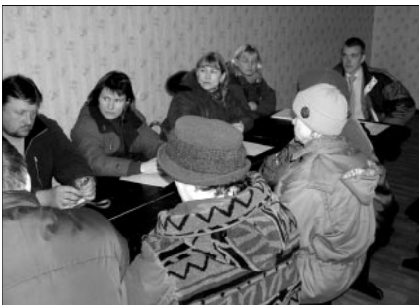
Arengukava arutelu Karula vallas Kaagjärve Külakeskuses.

Saamaks võimalikult laialdast nägemust meie piirkonna tuleviku kohta on läbi viidud arengukava avalikke arutelusid ning kohtumisi erinevate valdkondade spetsialistidega. Alustades konstaablist ja lõpetades koolijuhtidega. Veebruari lõpus toimus koostöös Maaelu Arengu Instituudiga ettevõtjatele mõeldud foorum, mille käigus üritati leida vastuseid tä-