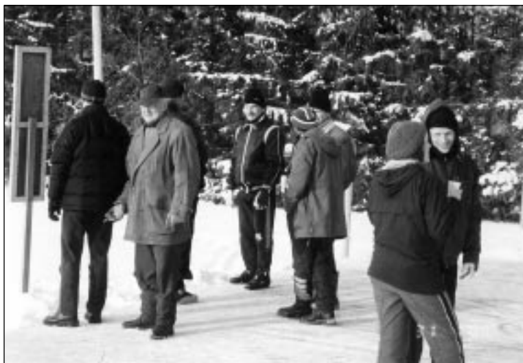
Talispordipäevade esimesel päeval toimus suusamaraton.

Kaugematest plaanidest tuleb nimetada suusaradade ümbertegemist. Planeeritakse praeguse viiekilomeetrise raja pisut kergemakstegemist. Üheks muuks on ka see, et Sibula kandis kulgeb rada üle sõidutee, autode ja inimeste jalajäljed aga mõjuvad suusarajale laastavalt.