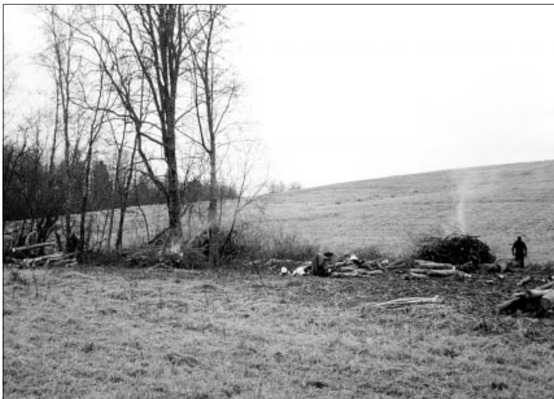
Võsalõikustööd jätkuvad ka aastal 2004. Fotol võsalõikus Rebasemõisas Tornimäel sügisel 2003.

tööks vajalike teaduslike andmete ja andmebaaside olemasolu ja kättesaadavuse tagamine ning kaitsekorralduse tulemuslikkuse analüüsimine. Tööülesannete hulka kuulub veel teadus- ja seirealase töö korraldamine ja koordineerimine, praktikantide ja praktikumide juhendamine ning infotehnoloogiat ja kodulehekülje haldamine ning täiendamine. Sel aastal peab seire ja andmehõive spetsialisti juhtimisel valmis saama uue kaitse-eeskirja eelnõu ning lõpule jõudma