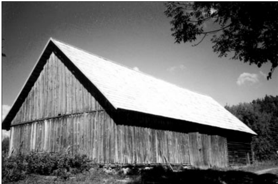
Jätkub vanade väärtuslike hoonete taastamine. Fotol 2003. aastal uue katuse saanud Suuresõõru-Hinni rehi.

Sihtasutuse Keskkonnainvesteeringute Keskus poolt finantseeriti 59 700 krooniga projekti “Karula rahvuspargi trükised”. Projekti tulemusena saab jätkuda infolehe väljaandmine, aasta jooksul antakse välja võrukeelne värviline infovoldik ja teemavoldik “Karula järved”. Samuti antakse välja eesti- ja soo-