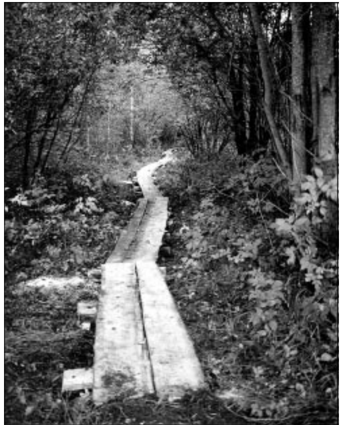
Jupike uut laudteed Ähijärve teerajal.

Viltimisteemalisel käsitööpäeval osales 46 enamas-