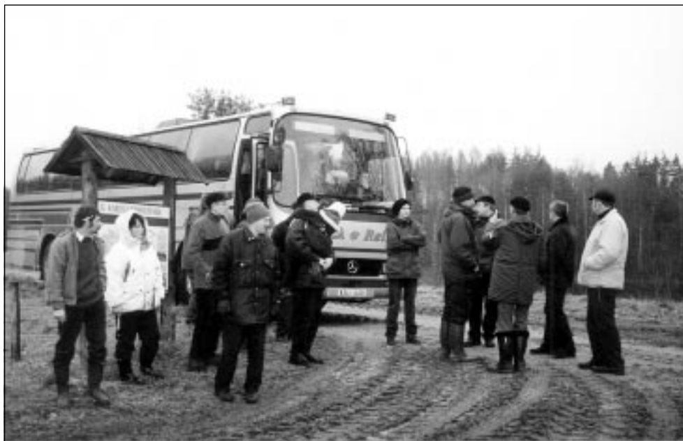
Matkapäev kohalikele elanikele on toonud matkalised Kolskisse.

Möödunud aasta märksõnadeks võiks pidada rahvuspargi 10.a juubelit ning kultuuripärandi kaitsetöid. Juubeliüritustest õnnestunuim oli kindlasti konverents "Loodus ja inimene", mille huvitavad ja harivad ettekanded said avaldatud ka infolehe juubelinumbris. Toredad olid hilissügisel toimunud matkapäevad, iseäranis see, mis suunatud kohalikele elanikele. Sama projekti raames korraldatud fotokonkursi tulemuseks valmis meeleolukas fotonäitus, see on praeguseni kõigile vaatamiseks üleval külastuskeskuse majutushoones.