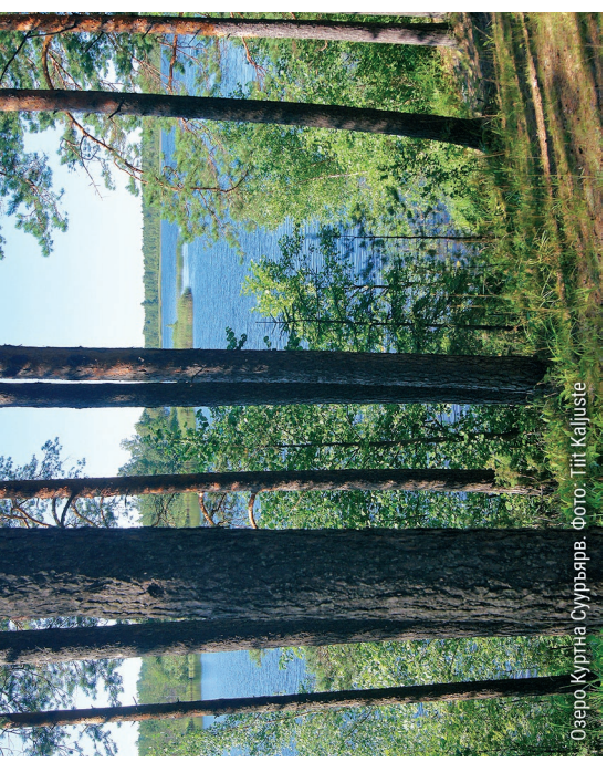
Озеро Куртна Вурьярв.