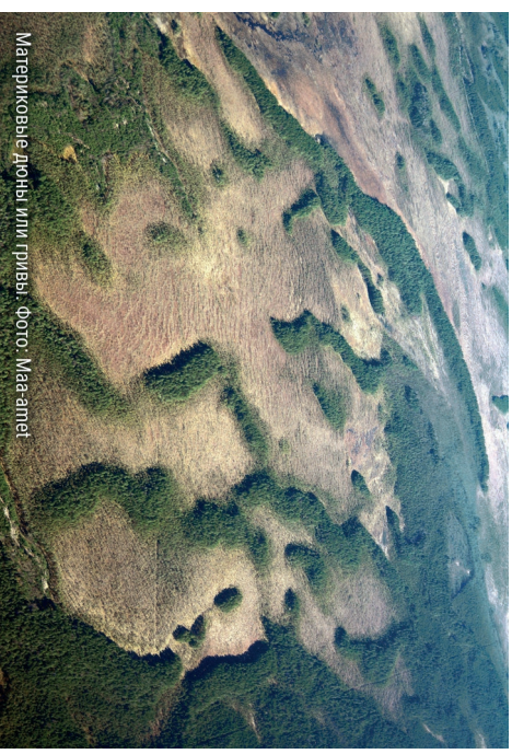
Материковые дюны или гряды.