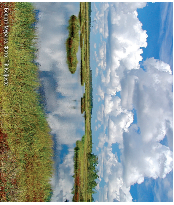
Болото Мурака

Расположенная в национальном парке болотная система Пухату является крупнейшей болотной системой Эстонии . На берегах реки Порунни растут ценные леса, напоминаящие первобытный лес.