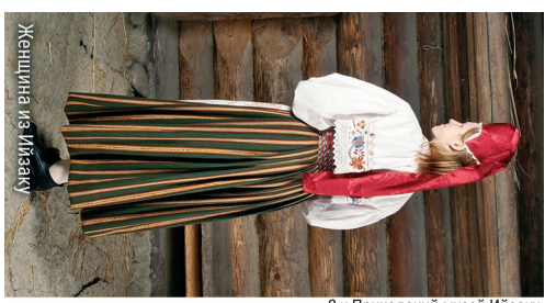
2 x Приходский музей Ийзаку

Помимо легенд о сыне Калева, в Алутагузе собрано также большое количество преданий о Богородице, русском богатыре Добрыне, княгине Ольге, Северной войне и Карле XII, чья золотая карета угонула в реке Ыльуга. В Вакнарава, у истока реки Нарова, находятся уникальные для Эстонии бунчи, или полузапруды.