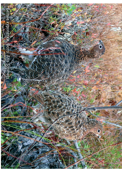
Ferislae Aulotalaku

Природные ландшафты национального парка Алутагузе служат местом обитания многих редких видов. Здесь обитают ставшие редкими в Эстонии обыкновенная летяга, белая куропатка и черный аист . В этом регионе можно встретить пять видов орлов, а также борodatую неясыть и сапсана. По территории Аугтагузе проходят пути миграции между Эстонией и Россией многих видов животных, в том числе волка, медведя и рыси.