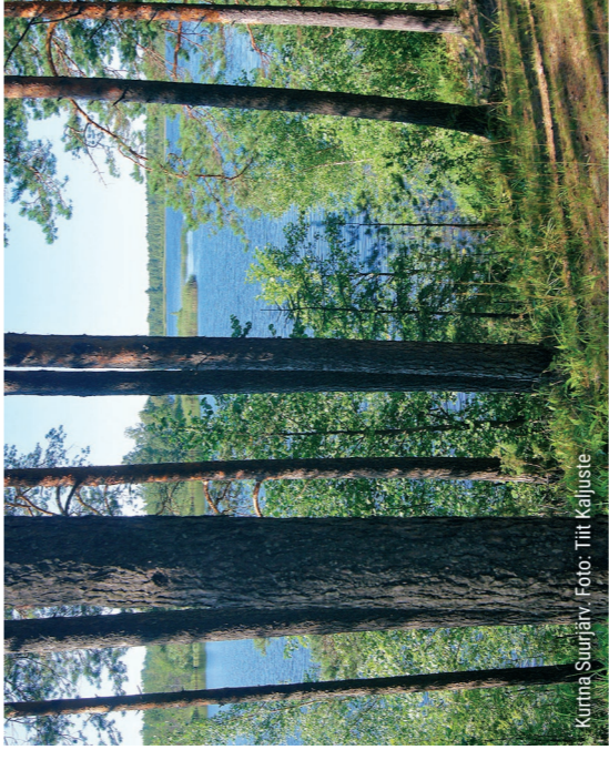
Kurtna Suurjärvi.