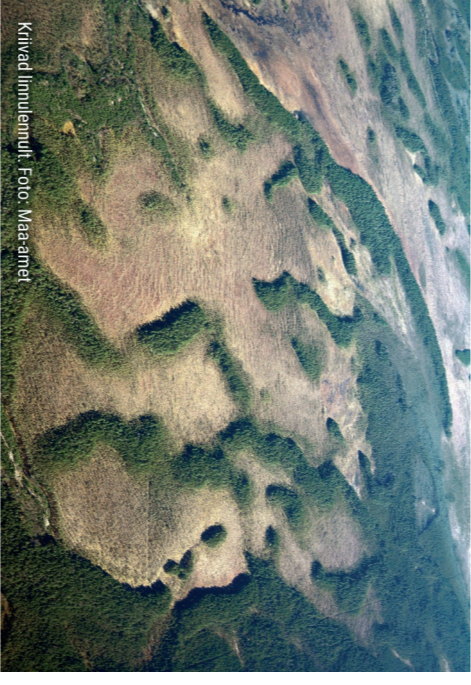
Kriivad Innulemmuli.