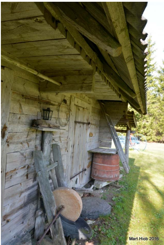
Foto 207. Kahtemetsa ait.