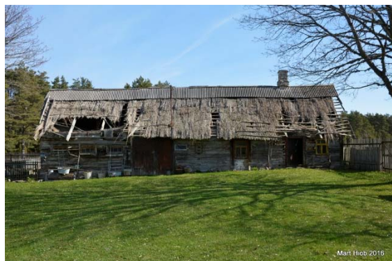
Foto 206. Kahtemetsa vanem pikkhoone.

Lümända-Kulli küla rahvusparki jäävas osas on vaid üks väljaehitatud majapidamine – Kahtemetsa – ning üks abihoone Kästiku maaüksusel. Kahtemetsa on asunikutalu, kus on mitmeid tähelepanuväärseid hooneid, sh käesolevas uuringus väärtuslikuks tunnistatud ait. Huvipakkuvad on aga ka hävimisprotsessis pikkhoone, uuem elumaja ja saun.