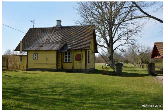
Foto 208. Kahtemetsa elamu.

Kästiku plekist autokuur ei ole märkimisväärne.