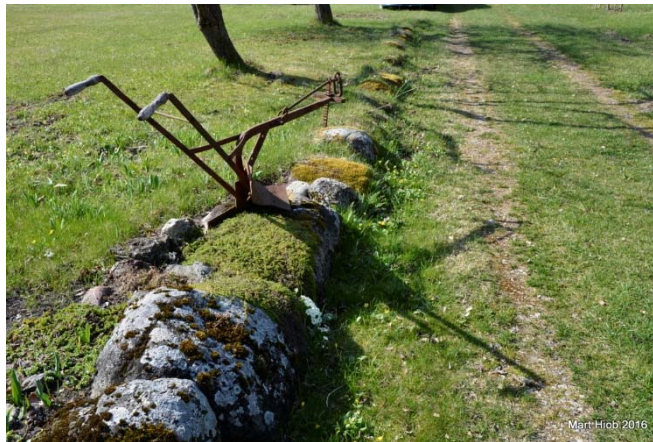
Foto 209. Kiviaed sissesõidul Kahtemetsa koha juurde. Foto Mart Hiob 2016.

Kiviaiad on mingil määral säilinud endise Arila talu juures ja Arila ning Kästiku vahel. Kahtemetsa sissesõidul on madal kiviaed.