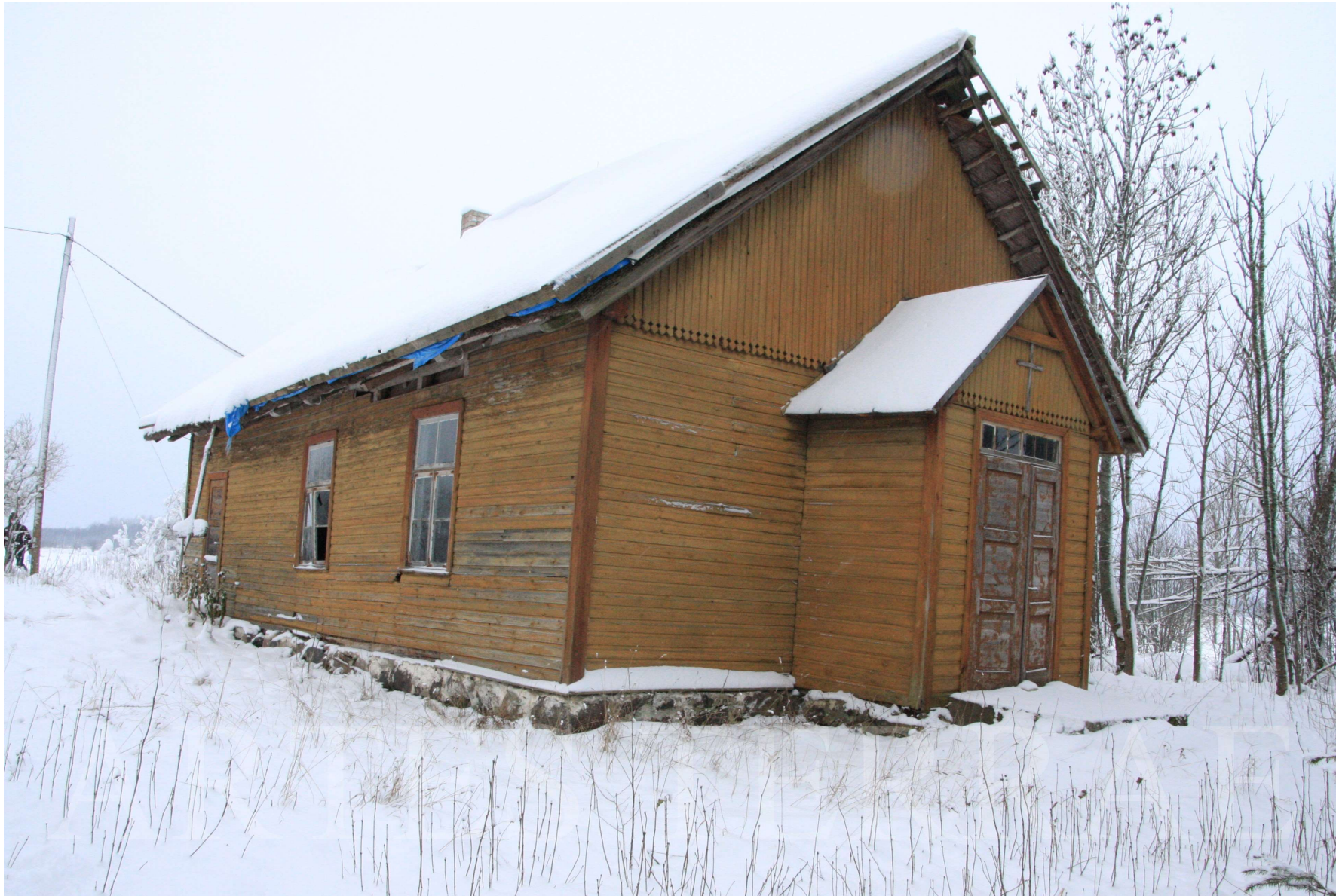
Rannametsa Baptisti palvela Keravere külas, kasutuseta