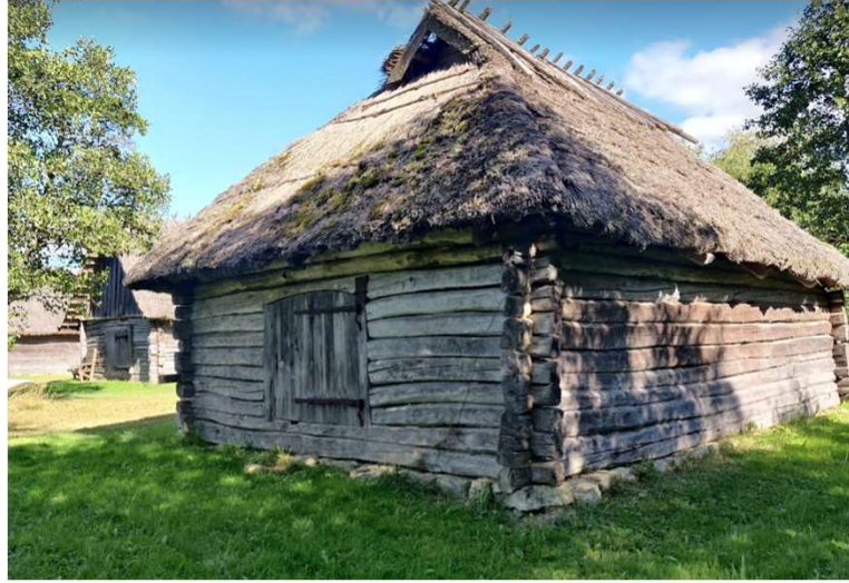
Kalurionnid Suitsu jõe ääres Ja Heinaküün Suitsu matkaraja lõpus