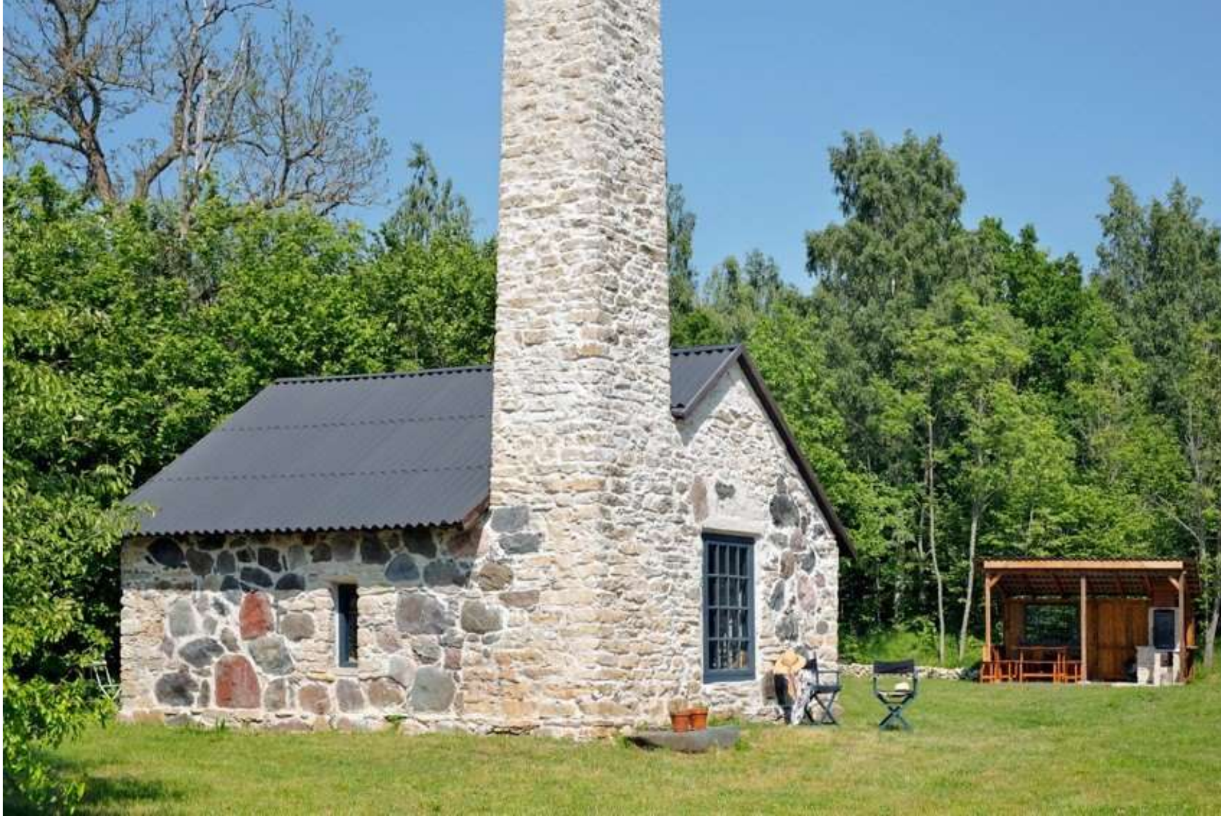
Saastna mõisa sepikoda- viinaköök Saleveres