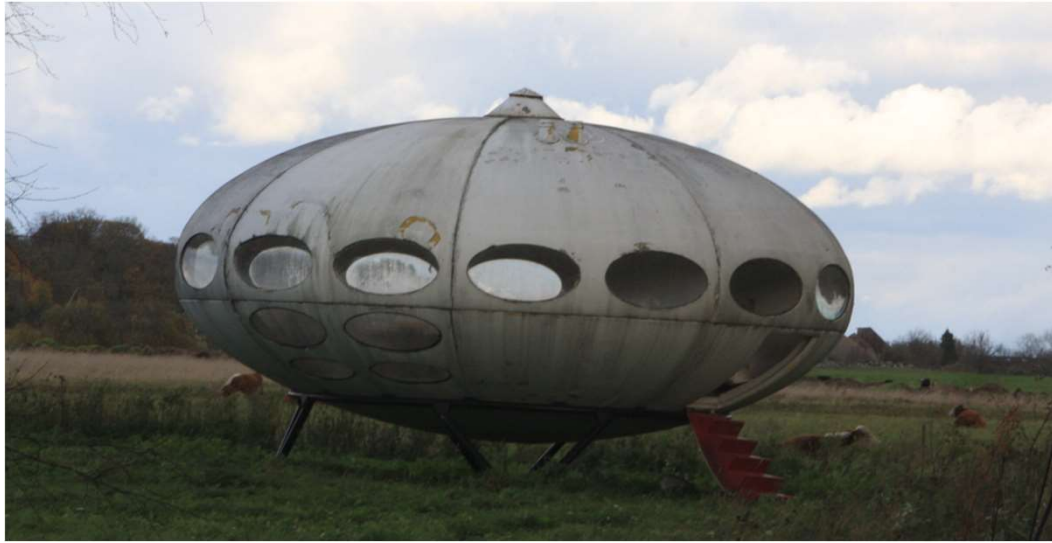
Matsalu ja Rannaküla