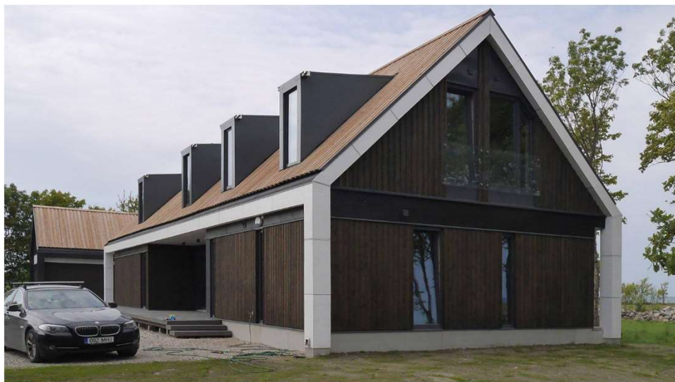
21. sajand Moodne maakodu Saastnas Arhitekt Enn Rajasaar