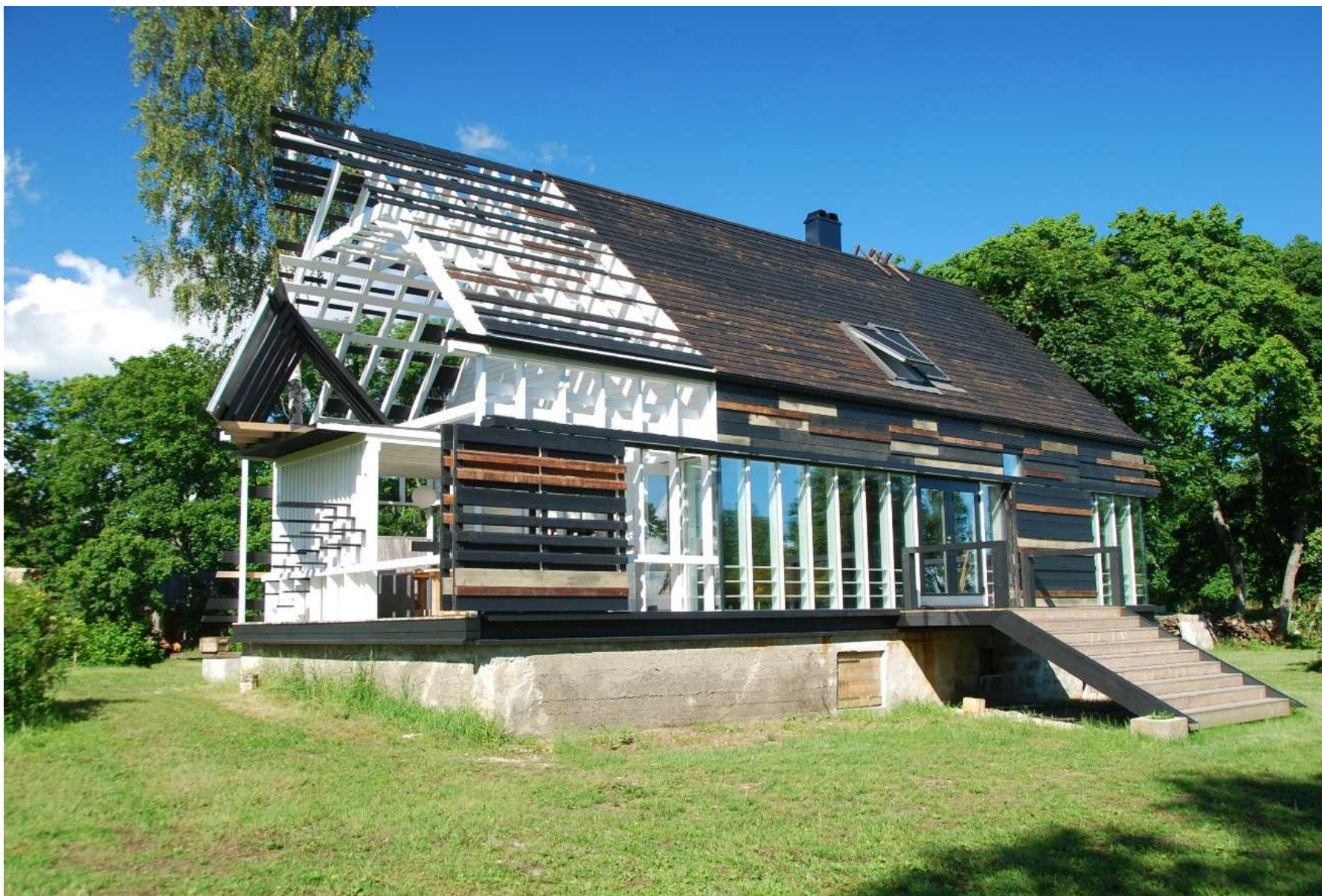
Uus maja vanal vundamendil Kesselaiul Arhitekt Indrek Almann