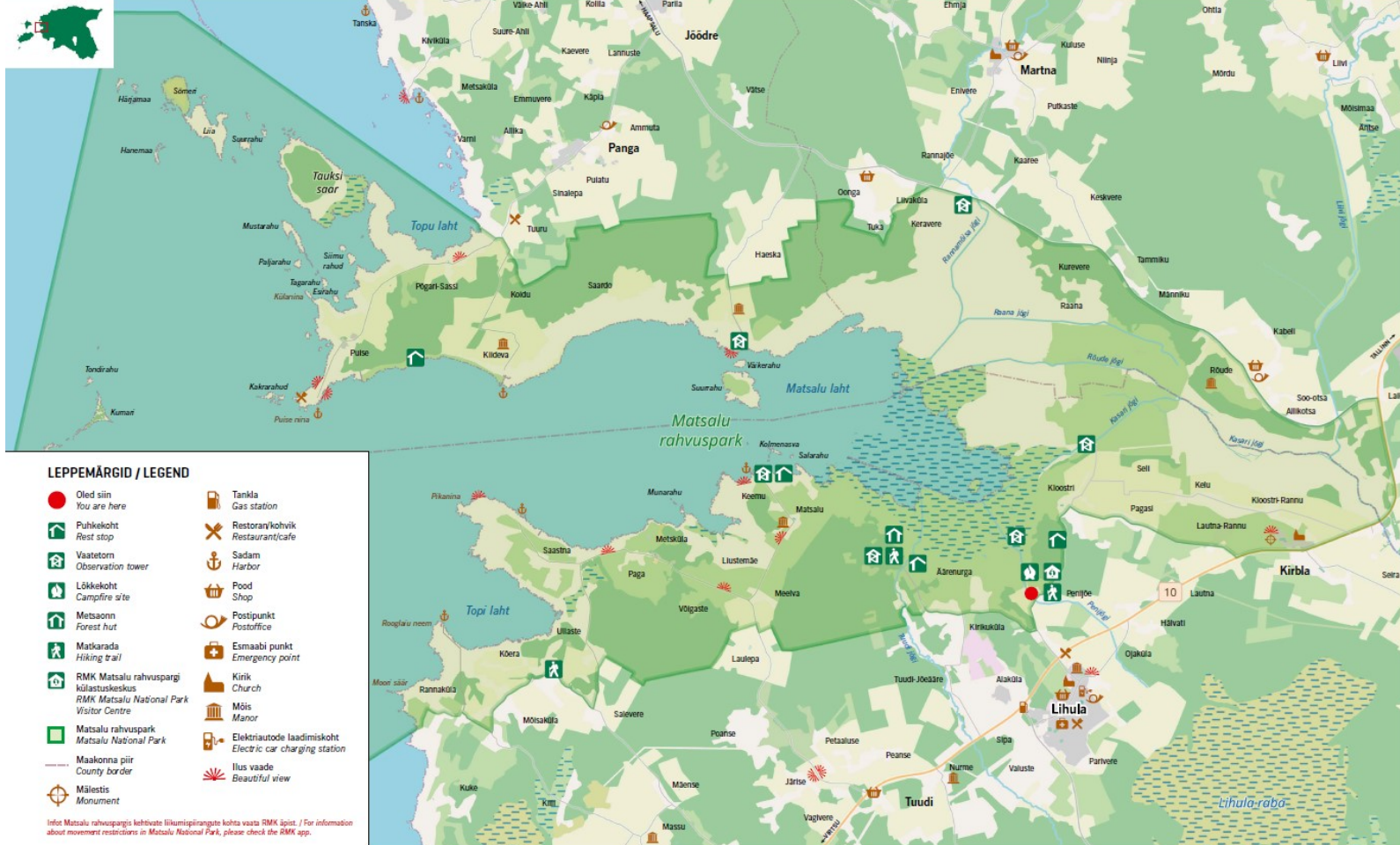
Joonis 1. Matsalu rahvuspark